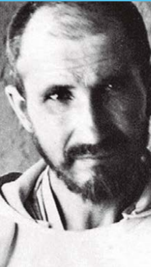
Charles de Foucauld

Ellos representan dos modelos de santidad que nos iluminan hoy. “Le agradezco su paciencia y me uno a usted en el amor del corazón de Jesús”, escribió Esteban al terminar.